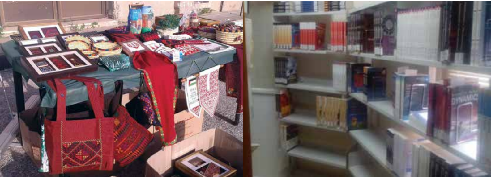
مشروع أيد بأيه

تمكنت الجمعية في مشروع (مكتبة إعارة كتب التخصص) من توفير الكتب التخصصية لحوالي 2500 طالب وطالبة، في 96 مادة دراسية، إضافة إلى مشروع (كوبونات الطلبة)، المدعوم من مركز التراث الفلسطيني في عمان، الذي يقوم على فكرة توزيع كوبونات الطعام، لتوفير وجبات للطلبة غير المقتدرين.